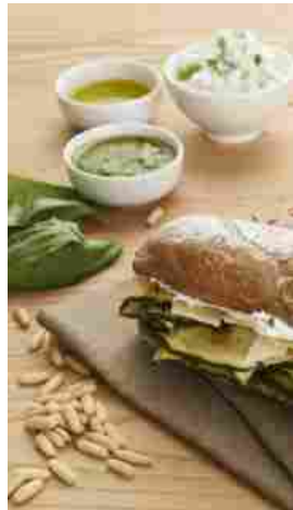
5/2010 Milano 2015