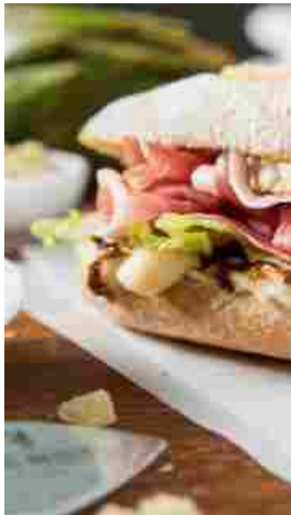
4/2010 Tra i due